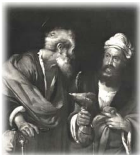
imm. Bernardo Strozzi: Pietro rifiuta denaro da Simon mago

Dopo aver risposto ad alcune utili domande che ci sono pervenute, torniamo a sviluppare l'enorme baratro spirituale che si è formato nei credenti cristiani che, accettando la versione catechistica cattolica dei comandamenti, non hanno tenuto conto del secondo comandamento biblico. [1]