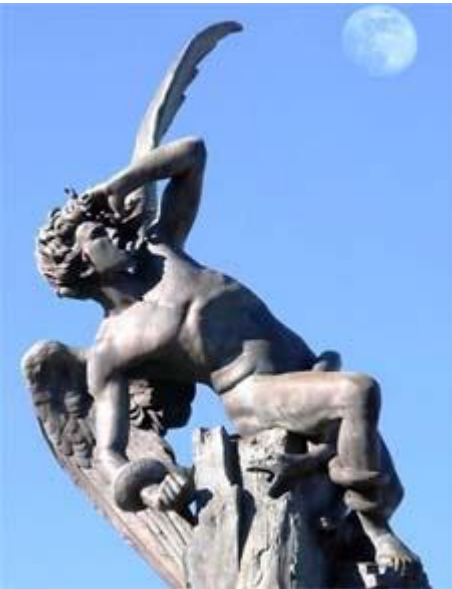
[Fontana dell'Angelo Caduto -Parco del Ritiro - Madrid]

Credo sia sempre bene ricordare che da moltissimo tempo è in atto una guerra nel cielo.